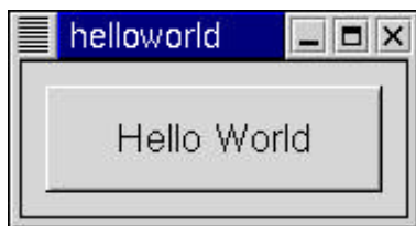
图2-2 Gtk 版本的“Hello World”

尝试一下，将鼠标放在窗口的边框处，按下鼠标左键，拖动鼠标以改变窗口大小，按钮会随之而改变大小。点击“Hello World”按钮会退出应用程序。